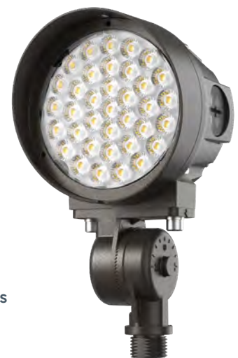
Dual Layered Lens