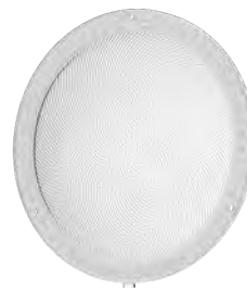
5x5 (50°) Flood