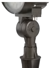
1/2" NPS Rotula Articulada